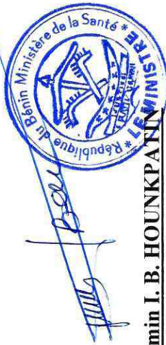
Benjamin I. B. HOUNKPANIN Ministre de la Santé

Les directeurs concernés sont tenus de rendre compte diligemment de la prise de service effective des agents affectés sous leurs ordres.